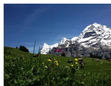
Schiltalp - Blumental